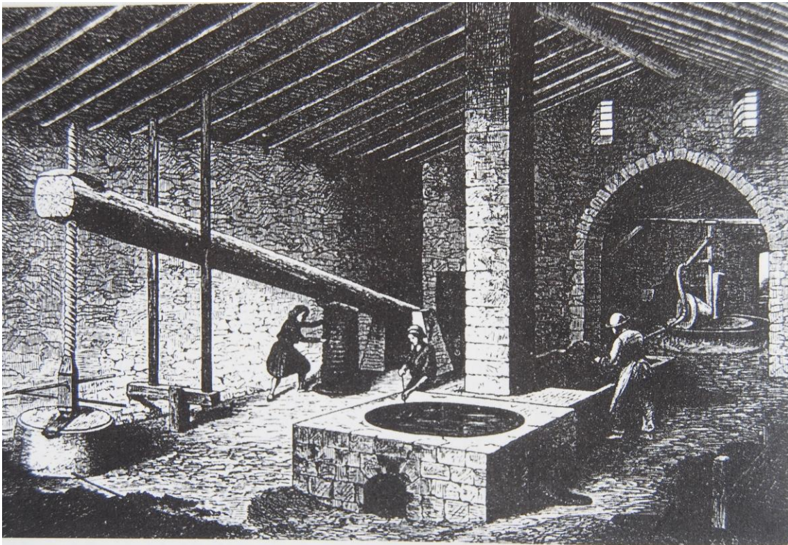
TAFONA DE COMASEMA

L'oli es produïa a la tafona , on una gran mola de pedra el trui , capolava l'oliva i després es premsava a la premsa , formada per la biga , i un torn que es girava l'espiga i un gran contrapès de pedra, el quintar . La major part de la producció s'exportava amb vaixells.