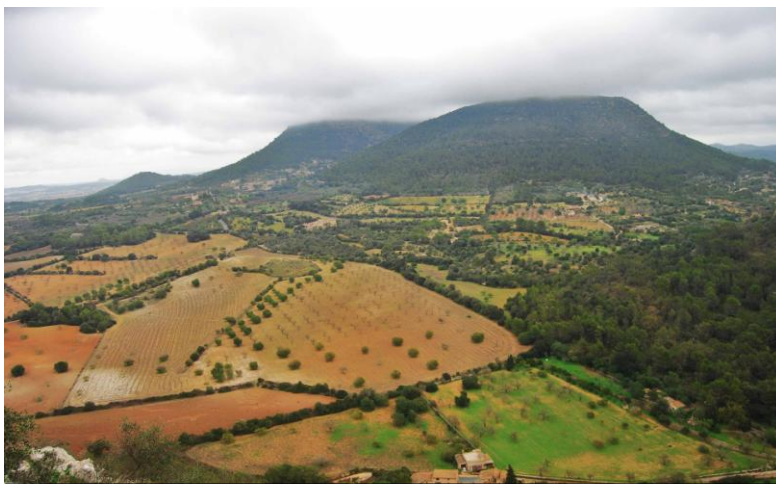
Es Pla de Mallorca vist des de la serra de Galdent. Al fons, el puig de Randa.

L'agricultura tradicional ha deixat la seva empremta en el paisatge agrari: elements com les marjades de la serra de Tramuntana, els molins d'aigua i de vent, safareigs i aljubs, cases de pagès i casetes de roters, tanques de parets i bardisses, sestadors per les guardes d'ovelles, etc.